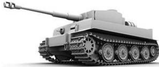
Duitse Tiger tank